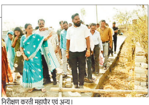
निरीक्षण करती महापौर एवं अन्य।

निर्माण कार्यों के निधारित शेड्यूल के अनुरूप ही कार्य किए जाएं तथा गुणवत्ता पर विशेष ध्यान अनिवार्य रूप से दिया जाए, अन्यथा कार्य की गुणवत्ता के प्रति उदासीनता दिखाने या शेड्यूल के अनुरूप कार्य न पाये जाने पर कड़ी कार्रवाई की जाएगी। विकास व निर्माण कार्यों में गुणवत्ता का होना आवश्यक है, ताकि दीर्घ समय तक विकास कार्य का लाभ आमजन को प्राप्त हो