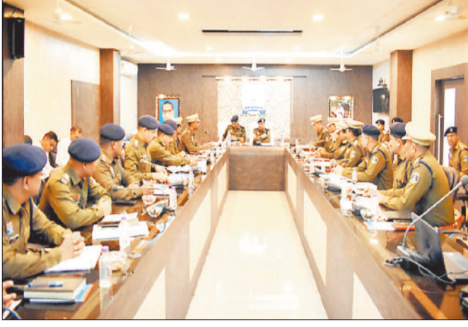
बैठक में अधिकारियों को निर्देश देते आईजी रामगोपाल गर्ग।

शनिवार 14 फरवरी को पुलिस महानिरीक्षक बिलासपुर रंज रामगोपाल गर्ग द्वारा जिला के पुलिस अधिकारियों का समीक्षा बैठक पुलिस कार्यालय के सभा कक्ष में लिया गया। बैठक के दौरान आईजी श्री गर्ग ने जिले की कानून- व्यवस्था की स्थिति का समग्र मूल्यांकन किया गया। विगत अवधि में दर्ज अपराधों, गंभीर एवं संवेदनशील प्रकरणों, लंबित अपराधों की विवेचना की प्रगति तथा चालानी कार्यवाही की समीक्षा की गई। विशेष रूप से चोरी, लूट, नकबजनी, मारपीट, महिला एवं बाल अपराध, साइबर अपराध तथा अवैध शराब/नशे के कारोबार से संबंधित मामलों पर विस्तार से चर्चा की गई। पुलिस महानिरीक्षक द्वारा निर्देशित