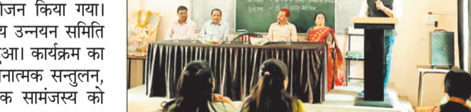
व्याख्यान में उपस्थित छात्र-छात्राओं को संबोधित करते अतिथि।

शासकीय एमएमआर पीजी महाविद्यालय चांपा में मानसिक स्वास्थ्य उन्नयन पर व्याख्यान का आयोजन किया गया। व्याख्यान महाविद्यालय के मानसिक स्वास्थ्य उन्नयन समिति और रेडक्रॉस के संयुक्त तत्वावधान में हुआ। कार्यक्रम का उद्देश्य व्यक्तियों में सकारात्मक सोच, भावनात्मक सन्तुलन, तनाव प्रबंधन, आत्मविश्वास और सामाजिक सामंजस्य को विकसित करना था।